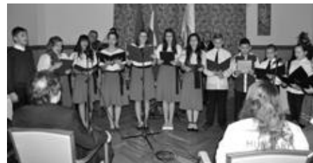
Zenés köszöntő- Egressy Béni Zeneiskola- Felkészítő Pujov J. ig.