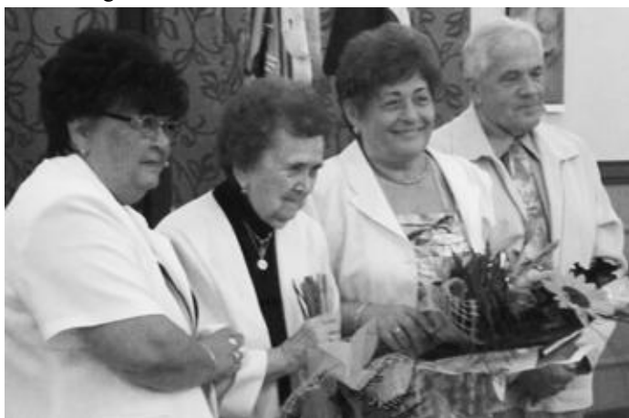
A kitüntetett pedagógusok szeretteik körében