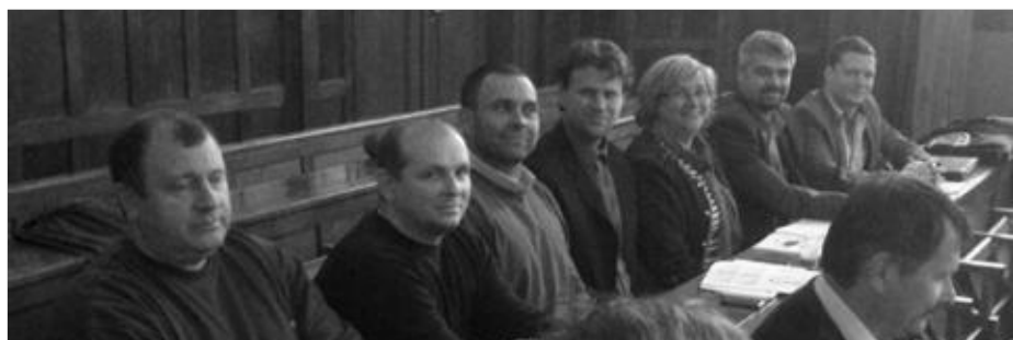
2014. november 26-án a mezőtúri Városházán szervezték meg a képviselők továbbképzését melyen a szomszéd település képviselői mellett a túrkevei városvezetők is részt vettek.