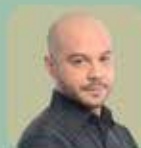
Horváth Csongor színművész